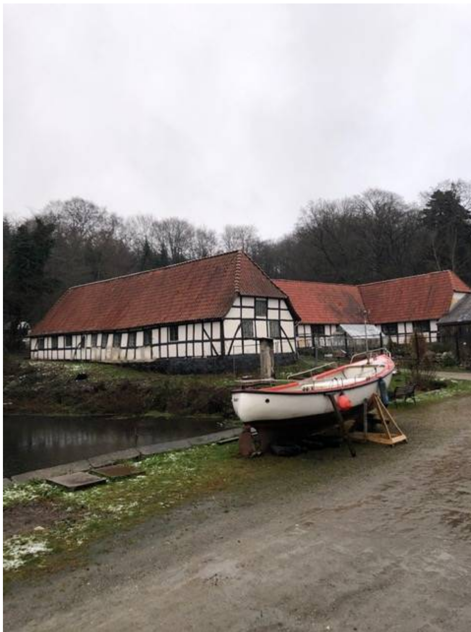
De tre udlænger på Skovmøllen